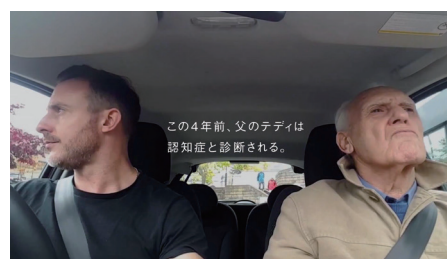
SOMPO ホールディングス TV-CM