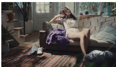
ABCマート PUMA TV-CM