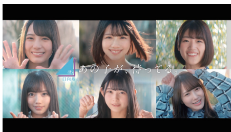
日向坂46 / 欅坂46 forTUNE music TV-CM