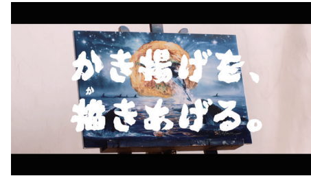
どん兵衛 鬼かき揚げ×ラッセン「鬼描き揚げる」