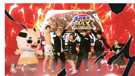
エースコック スーパーカップMAX