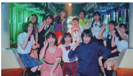
BEYO000ONDS 眼鏡の男の子 MV